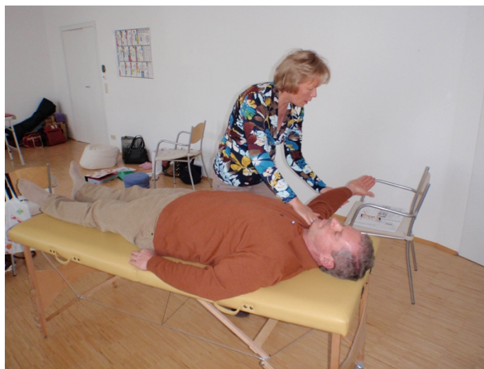
Test des mittleren Trapezius/ Milz-Pankreas - Meridian

oder Gesund durch Berühren ist die Basis aller nachfolgenden Kinesiologieformen, eine Synthese aus Chiropraktik, östlicher Heilkunst (Lehre von den Meridianen und den 5 Elementen), Akupressur, Erkenntnissen der westlichen Schulmedizin und Ernährungslehre. Symptome jeglicher Art lassen sich aus energetischer Sicht auf eine Imbalance (= Ungleichgewicht, Blockade) des Energieflusses zurückführen. Mithilfe des Muskeltests ist es möglich jene Blockaden festzustellen und die geeignete Methode zum Energieausgleich herauszufinden. Zu den angewandten Methoden gehören u.a. die gezielte Aktivierung (massieren, berühren, klopfen, ...) von Akupunkturpunkten, Reflexzonen, Muskeln, Meridianverläufen sowie Techniken zum emotionalen Stressabbau und zur Minderung von Schmerzen. TfH ist für jeden Menschen erlern- und anwendbar, frei von schädlichen Nebenwirkungen und idealerweise Bestandteil jeder „Hausapotheke“.